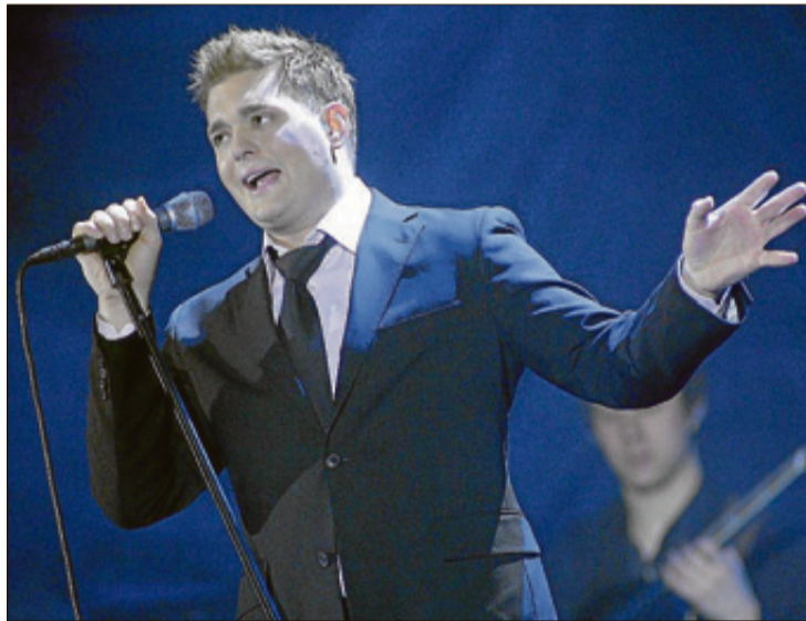
Michael Bublé durante una actuación.

«Pienso que es importante ser libre y encontrar felicidad (...), de la forma que puedas», agregó Bublé, quien apostilló: «Siento que no quería que mi alegría fuera robada por nada ni nadie e intenté tratar de dejar ir las cosas».